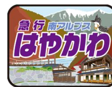
特製ヘッドマーク