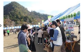
食まつり会場の様子

早川町内の特産品であるジビエ料理、そばなど旬の食べ物が一堂に会するイベントです。各種出店のほか、会場内ステージでは地元学生によるパフォーマンスもあります。