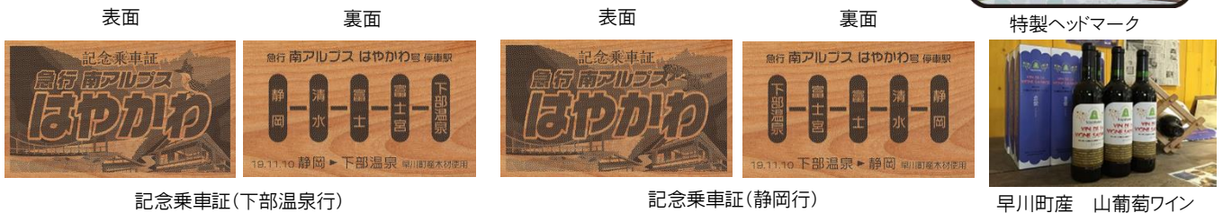
記念乗車証(下部温泉行)