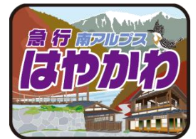
特製ヘッドマーク