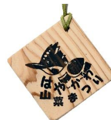
早川町オリジナル木製ペンダント(イメージ)