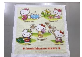
ハンドタオルイメージ

※コース詳細については、コース開催日の約1週間前からさわやかウォーキングホームページ ( https://walking.jr-central.co.jp/ ) で公開するコースマップでご案内します。