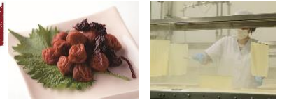
長谷川醸造 小梅ぼし ゆば工房五大 製造風景 ※ゆば工房五大は近日サイト掲載予定