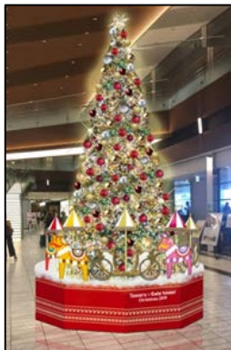
タワーズプラザ レストラン街12階

今秋全面リニューアルを完了したタワーズプラザ レストラン街（12階広場）には、1階と連動した装飾の高さ約7mのツリーが設置されます。また、ゲートタワープラザ レストラン街（12階広場）にはフォトスポットとして楽しめる高さ約3.6mのビッグサンタが登場します。