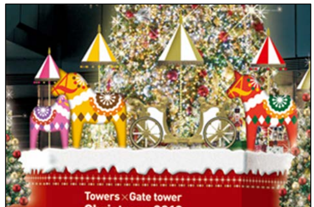
ツリーの周りを回るメリーゴーラウンド