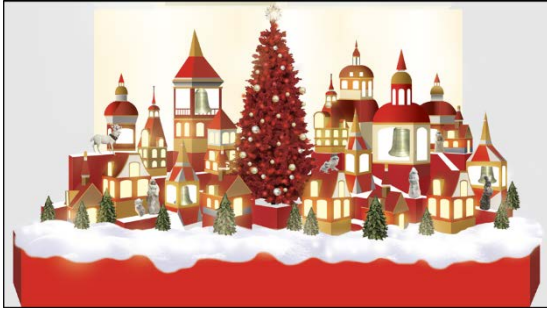
ジェイアール名古屋タカシマヤ1階

テーマは『Ring & Link ~“愛がつながるクリスマス”~』。ジェイアール名古屋タカシマヤ1階では、ベルの音でつながる「愛」を表現。赤色のビッグツリーがお客様を非日常の世界へと誘います。タカシマヤ ゲートタワーモール2階では、‘ゆめかわ’色のサンタや動物達がベルと共にお客様をお出迎えします。