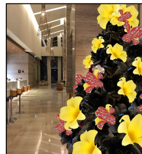
名古屋JRゲートタワーホテル15階