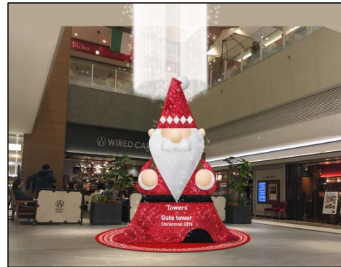
ゲートタワープラザ レストラン街12階