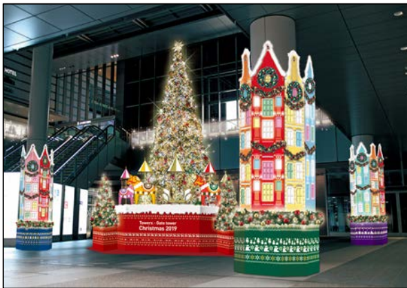
クリスマスツリーイメージ