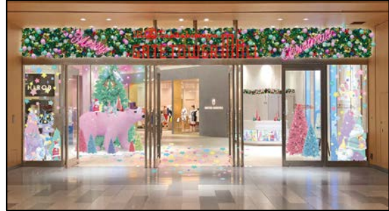
タカシマヤ ゲートタワーモール2階