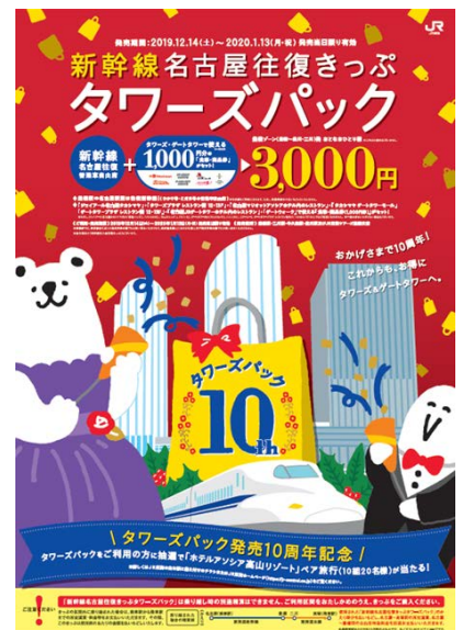
Towers Pack ポスター

https://railway.jr-central.co.jp/tickets/towerspack/index.html