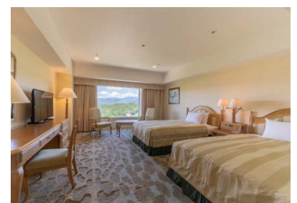
ホテルアソシア高山リゾート 客室の一例(禁煙スタンダードツイン)