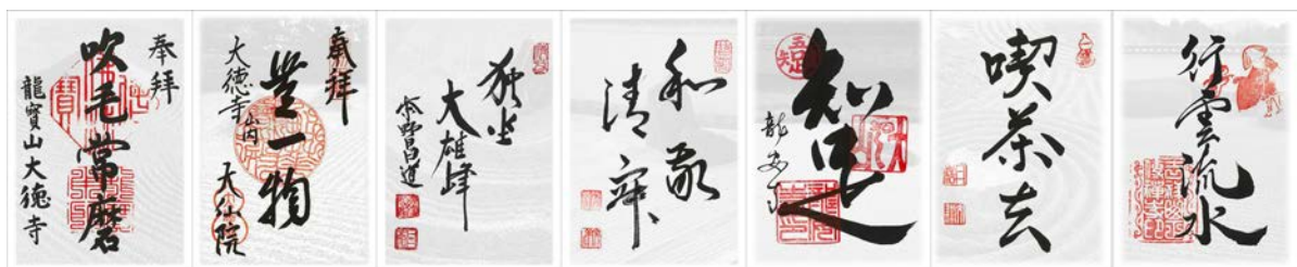
<禅語御朱印イメージ>

「禅めぐり帳」をお持ちの方を対象に、禅語が書かれた当企画オリジナルの「禅語御朱印」がいただける「禅語御朱印授与引換券」を配布（対象の7箇所の寺院のうち1箇所。2箇所目より有料。1枚につき別途300円）。禅めぐり帳に綴じて旅の思い出としてもお楽しみいただけます。