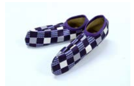
京の冬の足袋イメージ

和雑貨で人気の京都「くろちく」が制作する「そうだ 京都、行こう。」オリジナル京の冬の足袋。靴下の上から履けるので、寒い冬から早春にかけての寺院観光に便利です。