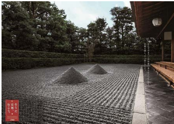
B0ポスターイメージ