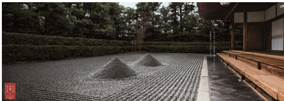
<石庭編ポスター イメージ>