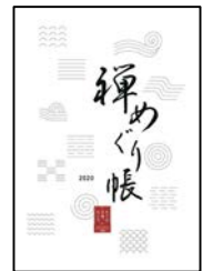
禅めぐり帳イメージ

対象寺院：大徳寺本坊（法堂・方丈・唐門）／大徳寺 大仙院／大徳寺 瑞峯院／大徳寺 龍源院／妙心寺 退蔵院／龍安寺／正伝寺