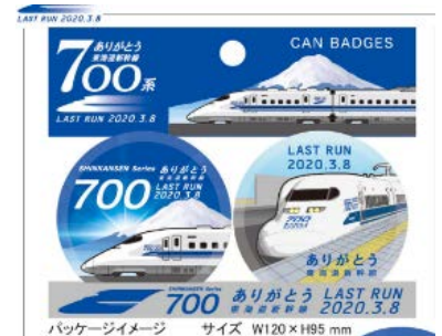
立誠社 「缶バッジ2個セット」 550 円

※掲載の写真・イラストは全てイメージです。 デザイン等は変更になる可能性があります。 ※表示価格は全て税込みです。