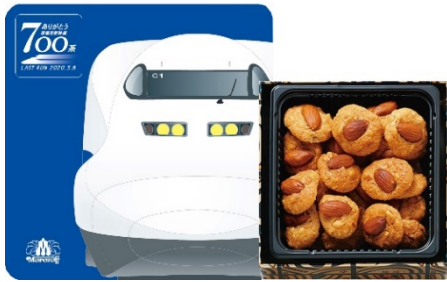
モロゾフ 「アルカディア」 648 円