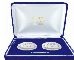
記念メダル(イメージ)