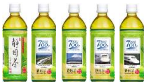
ありがとう東海道新幹線700系 静岡茶記念ボトル（500ml） 車内販売・自販機 160円/店舗 151円（1本）