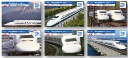
ありがとう東海道新幹線 700系記念カード(全6種)

700系新幹線がデビューした1999年当時に販売していた700系新幹線弁当の蓋デザインを復刻し、車内でも700系の思い出を感じられる東海道新幹線弁当が登場します。当商品には、ありがとう東海道新幹線700系記念カード(全6種類)が1枚付いています。約2か月間発売し、週毎にカードはデザインを変え、全6種類のカードが登場した後の残り2週間は、いずれかのカードが付いてきます。