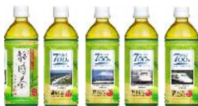
ありがとう東海道新幹線700系 静岡茶記念ボトル(500ml) 車内販売・自動販売機 160円・店舗 151円(1本)