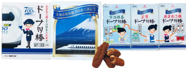
ありがとう東海道新幹線700系 ドーナツ棒 ※株式会社フジバンビとのコラボ商品 600円