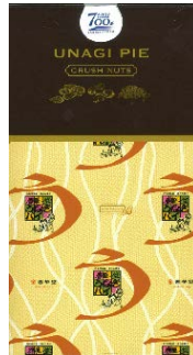
春華堂 「うなぎパイナッツ 縦型8枚入り」 981 円