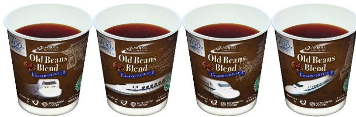
700系のデザインカップ(全4種)

700系新幹線がデビューした1999年当時に、車内で販売していた人気のコーヒーが復活。しっかりした苦みと重厚感のあるコクは当時のまま残しつつ、最近のお客様の嗜好を踏まえ、アレンジをしました。700系をデザインしたオリジナルの4種類のコーヒーカップにて2月1日より約1か月間限定でご提供します。