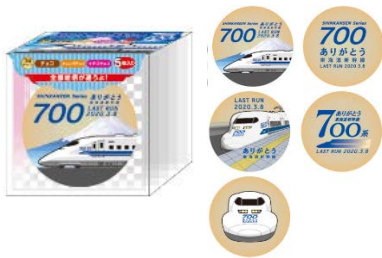
立誠社 「大判プリントラングドシャ 5枚入り」 648 円