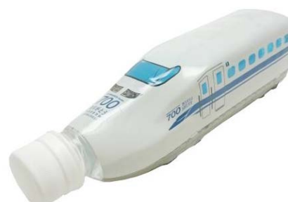
トレインボトルウォーター ありがとう東海道新幹線700系 381円