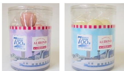
ありがとう東海道新幹線700系 いちごチョコレート（ピンク・ホワイト） ※株式会社アマンドとのコラボ商品 700円