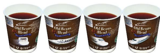
ホットコーヒー（オールドビーンズブレンド） レギュラーサイズ 320円/ラージサイズ 370円（1杯） ※デザインカップはレギュラーカップのみ