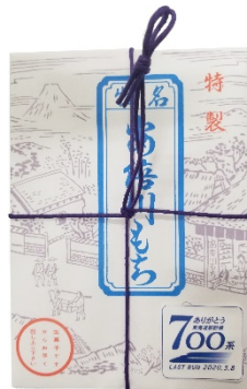
やまだいち 「安倍川もち」 720 円