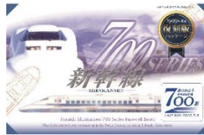
「ありがとう東海道新幹線700系」 記念弁当(イメージ)