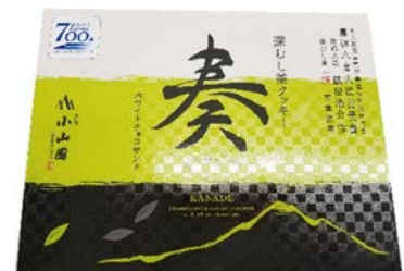
小山園 「深蒸し茶クッキー奏」 972 円