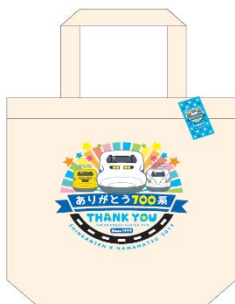
ヘソプロダクション 「トートバック」 2,200 円