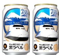
サッポロビール ありがとう東海道新幹線700系記念ラベル 車内販売 310円・店舗 252円(1本)