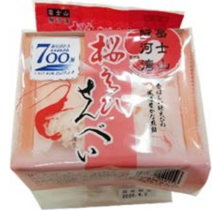
カネヨ商店 「桜えびせんべいキューブ」 540 円