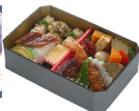
ありがとう東海道新幹線700系記念弁当 1,000円