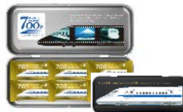
ありがとう東海道新幹線700系 クッキーチョコ 1,000円