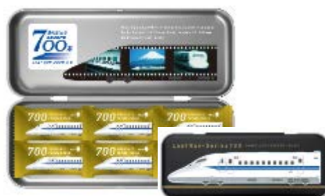
ありがとう東海道新幹線700系 クッキーチョコ ※株式会社メリーチョコレートカンパニーとのコラボ商品 1,000円