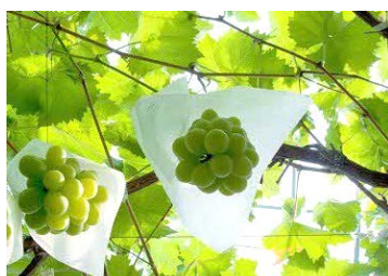
シャインマスカットイメージ