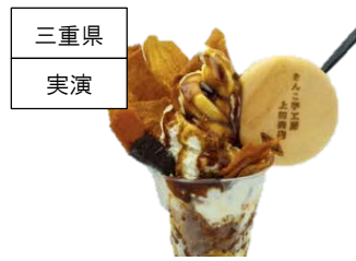
<きんこ芋工房 上田商店> きんこ芋と芋蜜のパフェソフト