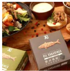
プレゼント商品イメージ