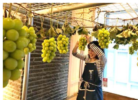
シャインマスカット狩り体験イメージ