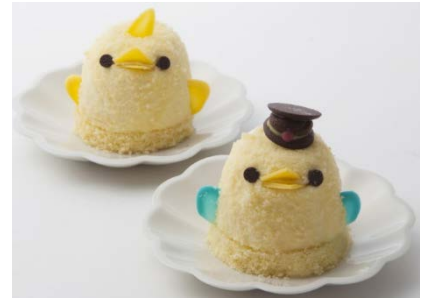
びよりん・駅長さんびよりん

「#びよりんチャレンジ」など、SNSでも話題の名古屋名物のケーキ。名古屋コーチンの卵を使ったプリンをバニラのババロアで包み込んだ「ひよこ」の形をしたスイーツ。すべて手作りのびよりんは、ひとつずつ表情が異なり、とてもキュート。