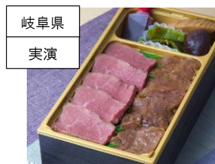
<金亀館>飛騨牛ステーキ &カルビ弁当