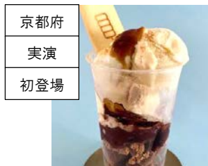
<梅園 oyatsu> みたらしパフェ