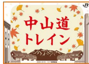
ヘッドマークミニタオル