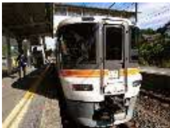
急行「▲▲中山道トレイン2020号▲▲」(373系車両)