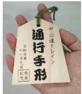
乗車証明書(昨年度版)

◇ 料 金 : 全車指定席の急行列車です。ご利用には、乗車券の他に急行券・指定席券が必要です。 ※運転できない場合は、当該列車の急行券・指定席券を無手数料で払い戻します。