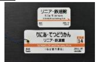
オリジナル駅名グッズ