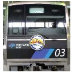
リニア・鉄道館 10周年記念車両