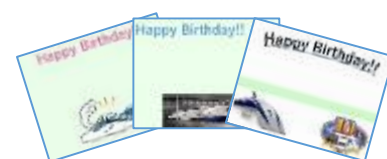
バースデーシール