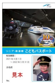
こどもパスポート