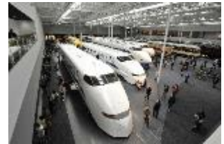
オープン当時の様子