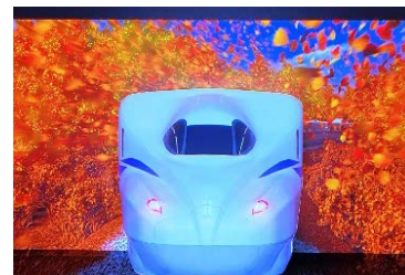
N700S プロジェクションマッピング

※昨年8月にジェイアール名古屋タカシマヤ「鉄道の未来展」で上映されたプロジェクションマッピングを常設展示用に再編集したものです。