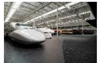
知りたい！聞きたい！鉄道のお仕事