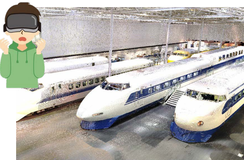
車両を真上から見た画像(イメージ)