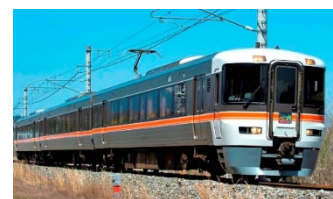
飯田線秘境駅号（373系）