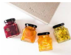
コンフィチュール 旅するコンフィチュール (横浜市)