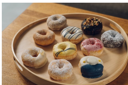
新幹線ドーナツセット