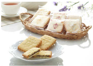
ビスカウト 馬車道十番館 (横浜市)