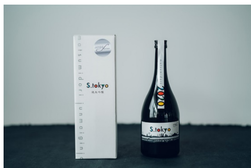
S.tokyo 2020 いいもの探訪 新幹線ボトル