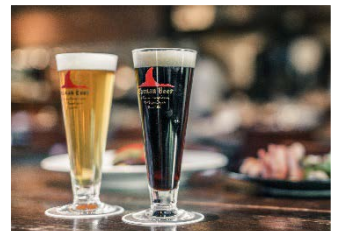
湘南ビール 熊澤酒造 (茅ヶ崎市)