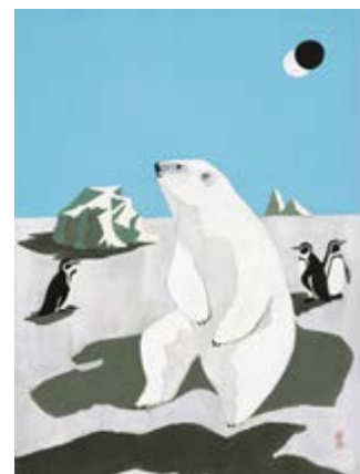
蓬春の代表作である「望郷」小下絵