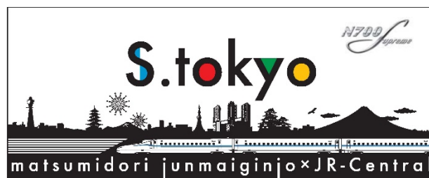
オリジナルラベル