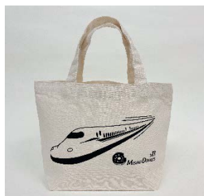
コラボトートバック