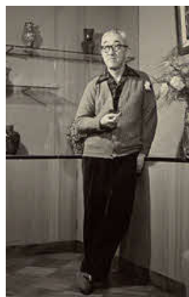
山口蓬春は海と山に囲まれた葉山の地を創作拠点に選んだ。