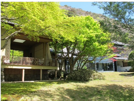
蓬春のアトリエ兼自宅に作品を展示する「山口蓬春記念館」。建築家・吉田五十八が手がけた。