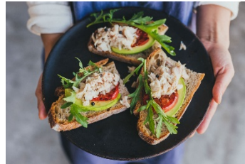
まぐろのコンフィ フィッシュスタンド (三浦市)