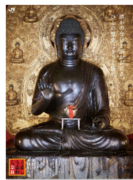
(ポスター：薬師如来像)

大切な人の健康を祈り、おだやかな日々を願い、見上げた空の広さと青さ。心が前を向き、晴れやかになる様子を表現しています。