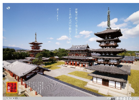
(ポスター：白鳳伽藍)