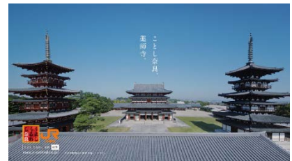
（キャンペーン動画の一部）