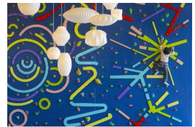
親子の北壁 (イメージ)