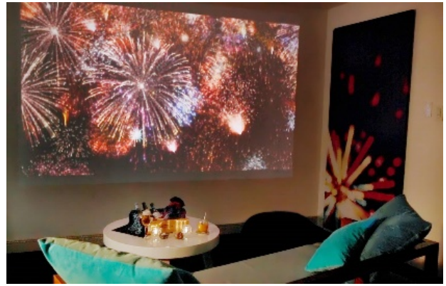
お部屋での花火鑑賞（イメージ）