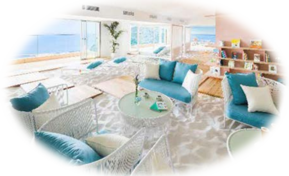
ソラノビーチ Books&Cafe（イメージ）