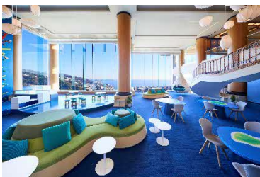
アクティビティラウンジ (イメージ)