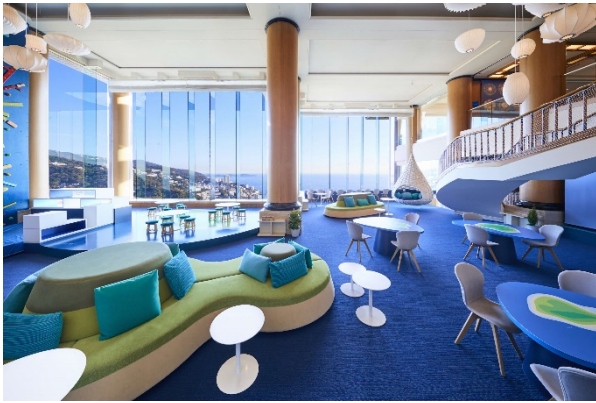
アクティビティラウンジ（イメージ）