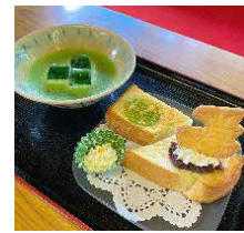
冷やしモーニング