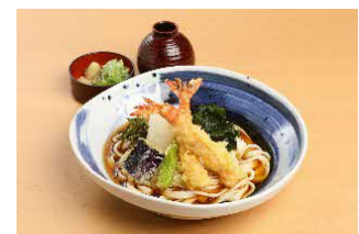
海老天おろしきしめん（冷やし）