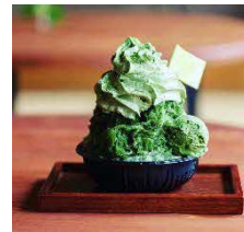
抹茶エスプーマかき氷