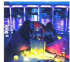
岡崎城下舟あそび