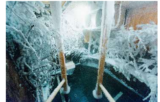
ウェルビー栄 アイスサウナ