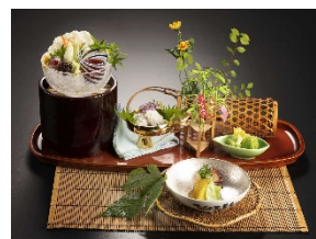
名古屋マリオットアソシアホテル 「日本料理 京都つる家」料理の一例

※旅行商品の詳細はジェイアール東海ツアーズにお問い合わせください。 JR東海ツアーズ JR TOKAI TOURS, INC.