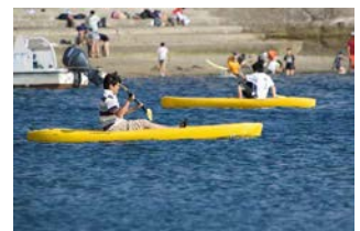
日間賀島キッズアドベンチャー