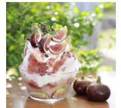
特濃安城いちじくかき氷