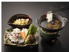
名古屋マリオットアソシアホテル 「中国料理 梨杏」料理の一例

また、日間賀島宿泊プランの他にも、名古屋マリオットアソシアホテル及びホテルアソシア豊橋にて、コースの一部に愛知県産のタコを使用した料理を楽しめるプランも販売する予定です。