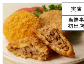
実演 当催事 初出店