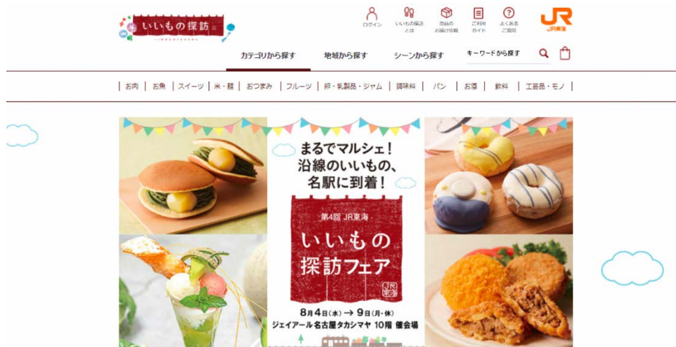
「第4回 JR東海 いいもの探訪フェア」特設サイトイメージ