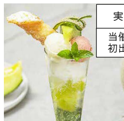
実演 当催事 初出店