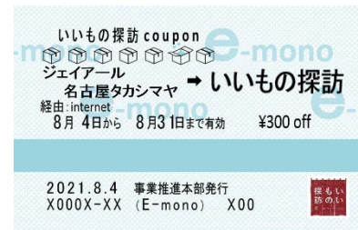
クーポンイメージ

※クーポンは、2021年8月31日（火）ご注文分まで何度でもご利用いただけます。