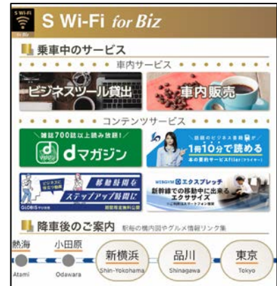
ポータルサイトイメージ