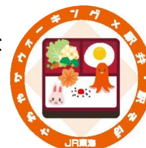
バッジデコレーション例