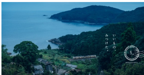
（特設ページメインビジュアル）

https://e-mono.jr-central.co.jp/shop/pages/5th-anniv.aspx