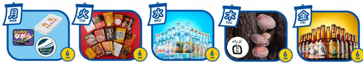
オリジナル鉄道グッズ 沿線のご当地 カレー30種 沿線のご当地 サイダー72本 原木しいたけ 栽培キット 沿線のご当地 ビール30本

現在、複数人でおトクな「EXのぞみファミリー早特」が「平日」にもご利用いただけます。ぜひこちらの商品も利用してキャンペーンへご参加ください。