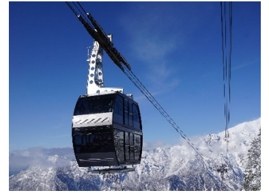
新穂高ロープウェイ