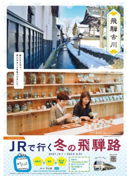
【B 1 ポスター】 飛騨古川