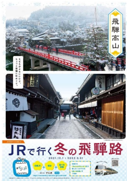
【B 1 ポスター】 飛騨高山