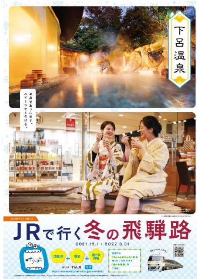
【B 1 ポスター】 下呂温泉