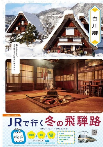
【B 1 ポスター】 白川郷