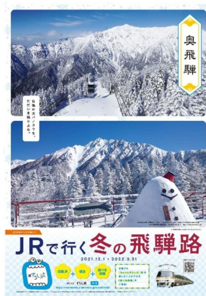
【B 1 ポスター】 奥飛騨