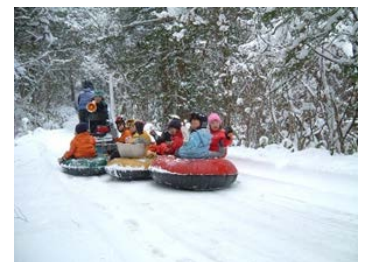
モンデウス飛騨位山スノーパーク