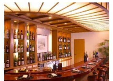
ホテルアソシア高山リゾート 日本料理 華雲 酒蔵バー