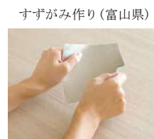
すずがみ作り(富山県)