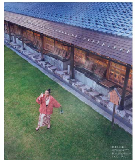
Japanese Beauty Hokuriku 2024.12.1 - 2025.2.28