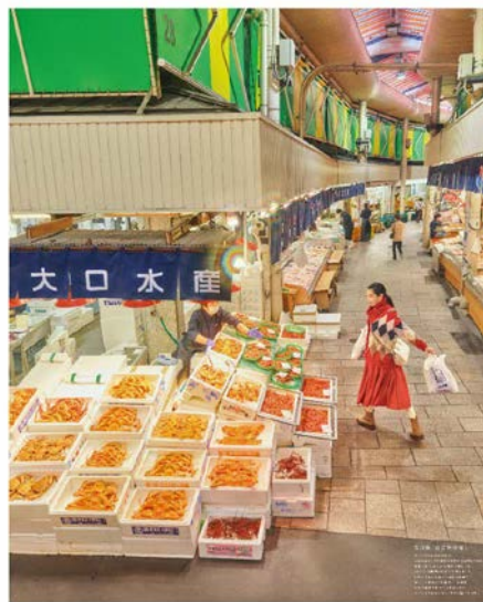
Japanese Beauty Hokuriku 2024.12.1 - 2025.2.28