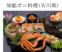
加能ガニ料理(石川県)