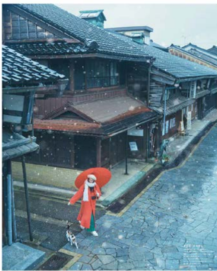
Japanese Beauty Hokuriku 2024.12.1 - 2025.2.28