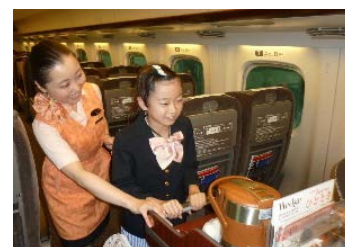
パーサー体験（イメージ）