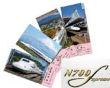
記念きっぷ (イメージ)

記念きっぷの発売は、新型コロナウイルス感染症の対策として、駅窓口での混雑や長時間お並びいただくことを避けるため、ネット通販のみとさせていただきます。