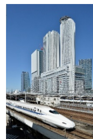
フリープラン(イメージ)

※発着駅等の詳細は、ジェイアール東海ツアーズHP ( https://www.jrtours.co.jp/ ) をご覧ください。