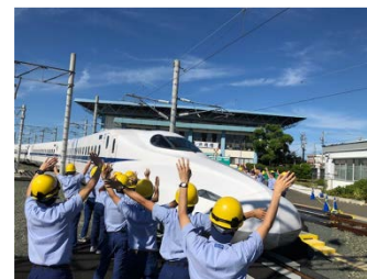
車両基地見学（イメージ）

(例) 子ども制服を着用して改札体験（小学生以下のお子様限定）、車内放送体験、回送線を通して車両基地へ潜入 他