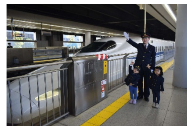
駅業務体験(イメージ)

※販売期間や旅行代金、購入方法等詳細は「のぞみ」号30周年Twitterアカウント(@nozomi30th)で順次お知らせいたします。