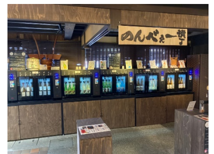
日本酒コインサーバー 「のんべえー横丁」

※未成年の方もご予約いただけますが、日本酒コインサーバーはご利用いただけません。