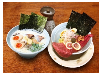
(右) 飛驒牛ラーメン