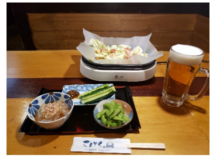
「けいちゃん」セット

名物「けいちゃん」に、「さんとか人気おつまみ3点セット」「選べるドリンク1杯」と下呂ならではのメニューをお楽しみいただけます♪