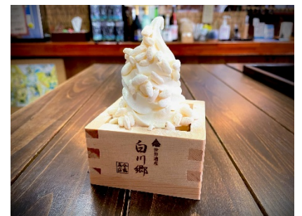
どぶろく風ソフト