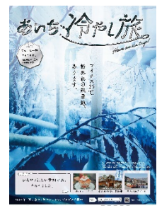
キャンペーンポスター