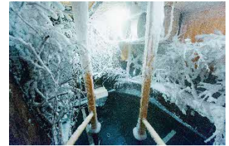
ウェルビー栄 アイスサウナ