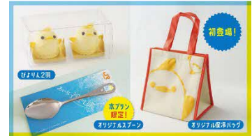
冷やし旅 特別セット