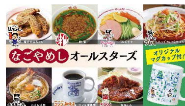
なごやめしオールスターズ企画