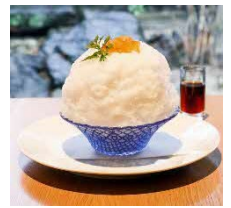
柚子みりんシロップのかき氷