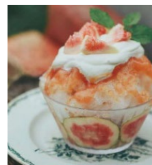
あいちスノーブーケ (一例)