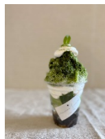
抹茶パフェ氷（大人ハーフ）