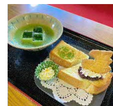
冷やしモーニング

※冷やしモーニングは 9:00～11:00 となります(数に限りがございます)。