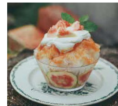
イチジクのプリンかき氷