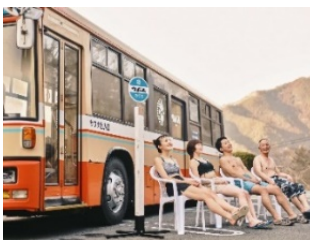
サバス×天然プール

また、ホテルアソシア豊橋では、キャンペーン期間中に『クレヨンしんちゃん』とコラボした「オラのぷろでゅーすルーム」を展開します。