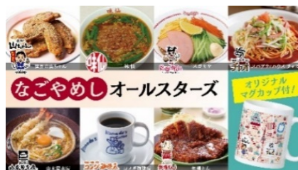
「なごやめしオールスターズ」コラボ企画