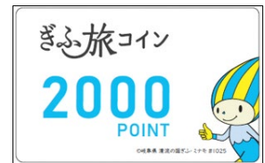
ぎふ旅コイン（イメージ）