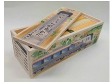
そうめん特急ひだ