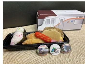
HC85系デビュー記念弁当