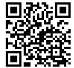
HC85系グッズ特設ページ