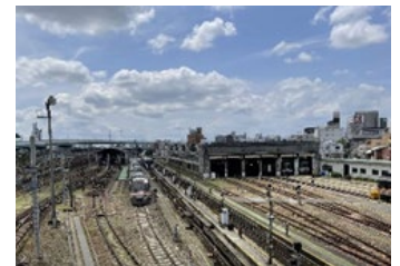
名古屋車両区（イメージ）

（ https://www.jrtours.co.jp/ ）・各支店にて販売を開始します。詳細はHPをご覧ください。