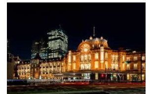
東京ステーションホテル（外観夜景）