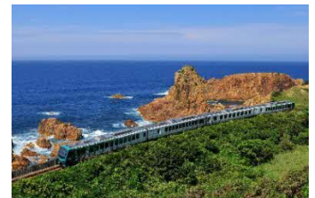
リゾートしらかみ