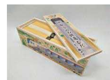
商品例（池利：そうめん特急ひだ）