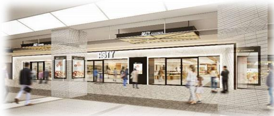
コンコースに面したメインファサード