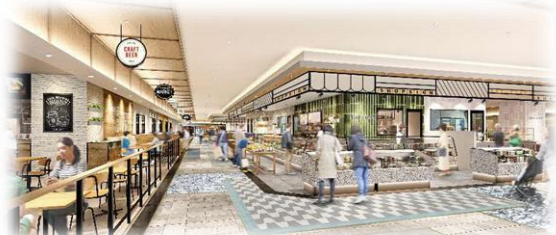
お買い物ができる、明るく居心地の良い空間