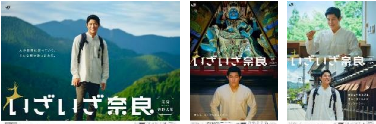
(ポスタービジュアル)