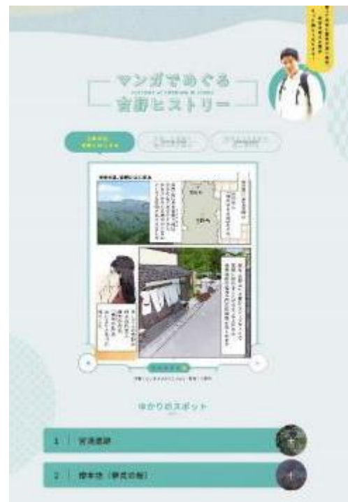
(特設サイトの一部)