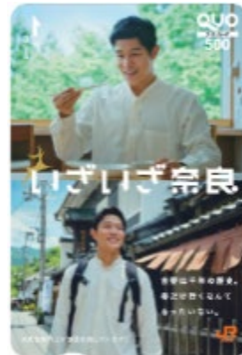
(オリジナルQUOカード)