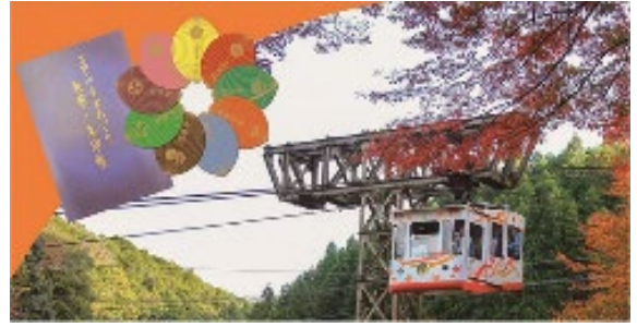
（秋の吉野ロープウェイと記念散華）