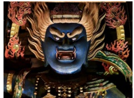
(秘仏金剛蔵王大権現)