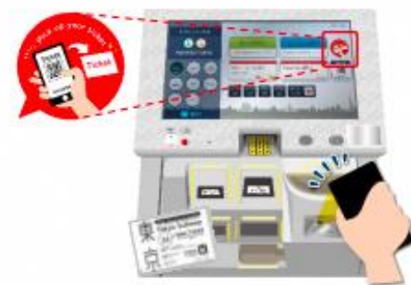
旅行者向け券売機

■「EX 旅のコンテンツポータル」についてはJR東海ホームページをご確認ください。