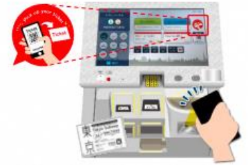
旅行者向け券売機

引換えQRコードによる発券に対応した旅行者向け券売機に、QRコードをかざすことでTokyo Subway Ticketを発券できます。 旅行者向け券売機の設置駅は、以下の路線図をご覧ください。