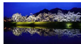
御所桜 開花の様子