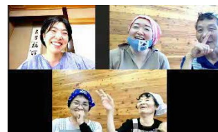
過去のヒダスケ!の様子