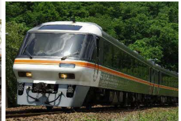
▲特急用気動車キハ85系