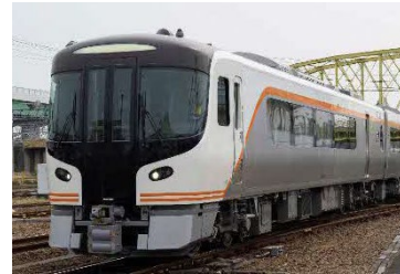
▲新型特急車両HC85系 (第21回日本鉄道大賞受賞)

京都鉄道博物館で、2月23日（木・祝）～3月5日（日）に開催する「新型特急車両HC85系・特急用気動車キハ85系特別展示」の関連イベントのお知らせです。 ※特別展示については2022年12月19日（月）に発表しています。