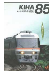
▲キハ85系登場時のパンフレット(左)・オレンジカード(右)