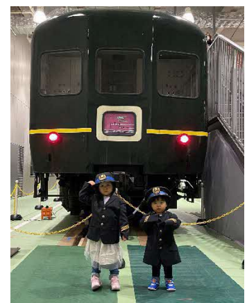
▲開催イメージ (写真はJR西日本制服)

【その他】子ども制服撮影会開催中は車両正面への立ち入りを制限させていただきます。