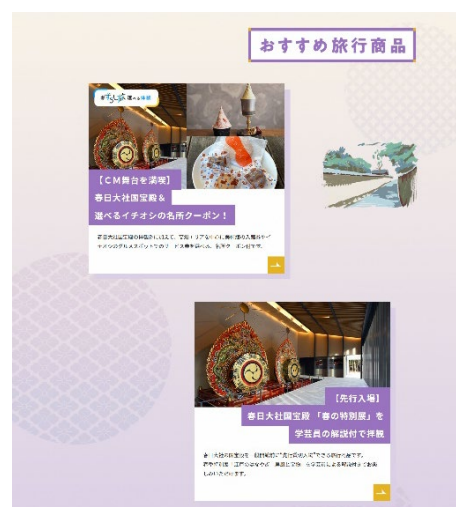
(特設サイトの一部)