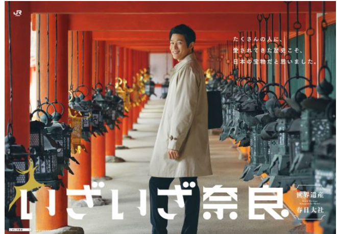
(メイングラフィック)