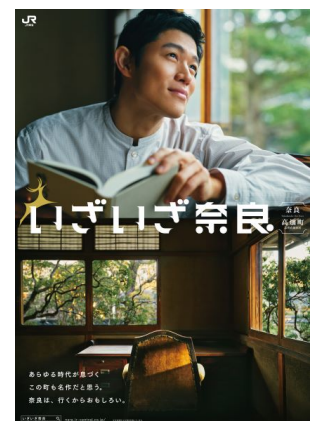
(ポスタービジュアル)