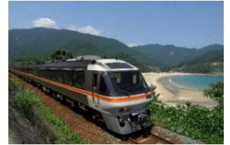
キハ85系 特急「南紀」号 (イメージ)

当社は2023年6月末を以てキハ85系の運転を終了し、7月1日（土）よりキハ85系で運転をしていた全ての列車を新型車両HC85系に統一します。1989年のデビュー以来、特急「ひだ」号、特急「南紀」号として親しんでいただいたキハ85系での最後の旅をお楽しみいただけるよう感謝の気持ちを込めて特別編成で特急「ありがとうキハ85系南紀」号、特急「さよならキハ85系」号を運転します。また、キハ85系のグッズの発売をします。