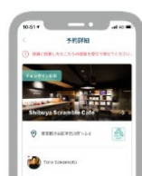
3. お店に荷物を預ける