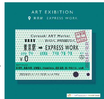
販売サイトのメインビジュアル

※展示されるアート作品や販売サイトなど詳細は、準備が整い次第 EXPRESS WORK 公式ウェブサイト ( https://expresswork.jr-central.co.jp/ )にてお知らせします。