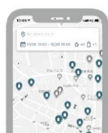
1. 荷物を預けるお店を選択