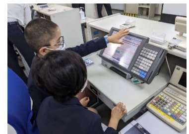
きっぷの発券体験（イメージ）