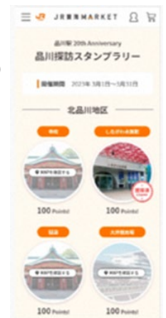
特設ページイメージ