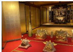
加賀伝統工芸村 ゆのくにの森「黄金の間」