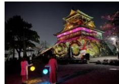
丸岡城プロジェクトマッピングナイト「ヒカリ結び」