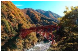
黒部峡谷トロッコ電車(新山彦橋)