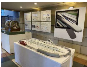
リニアブース（JR東海）