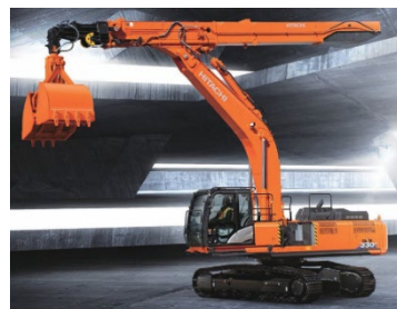
大型重機展示（施工会社）