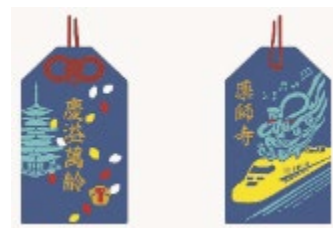
(コラボお守りデザイン)

国宝・東塔と西塔の内陣にある釈迦八相像を拝観でき、参拝者にはドクターイエローコラボお守りを授与します。