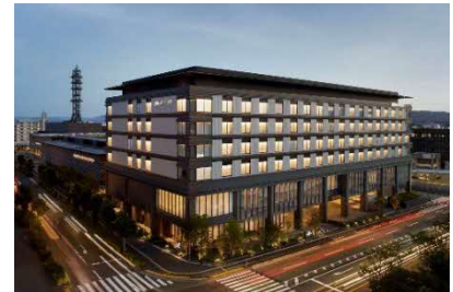
(JWマリオット・ホテル奈良 外観)