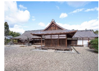
(唐招提寺・御影堂)