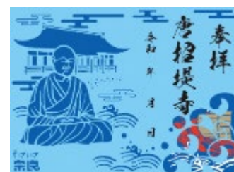
(オリジナル切り絵御朱印)