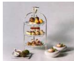
(コラボアフタヌーンティー)

期間限定で「いざいざ奈良」キャンペーンとコラボしたアフタヌーンティーを提供します。奈良ならではの秋の味覚をふんだんに盛り込んだ特別メニューをぜひご堪能ください。詳細は、JWマリオット・ホテル奈良HP ( https://www.flyingstag.jw-marriott-nara.com/groups ) をご確認ください。