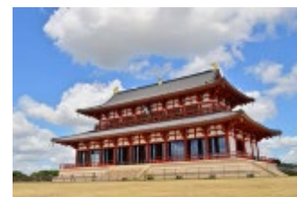
(平城宮跡 第一次大極門)

奈良文化財研究所の研究者による解説付きで平城京跡を巡り、建物や文化財を「生きた歴史」として体感することのできる散策企画です。