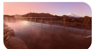
ニュー八景園 天空露天風呂