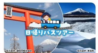
日帰りバスツアー