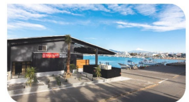
用宗みなと温泉 外観