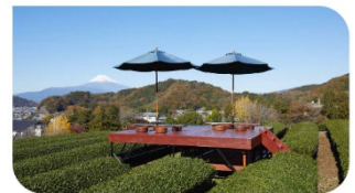
茶畑に浮かぶ天空のテラス