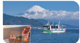
水上バスとランチBOX