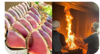
鰹のたたきと藁焼き体験