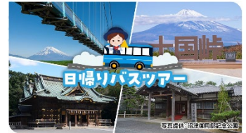
日帰りバスツアー

※その他にも観光プランを多数ご用意しています。各プランの詳細は、以下の特設サイトをご覧ください（「もれなく富士山」でご検索ください）。