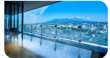
展望温浴施設「富士の湯」