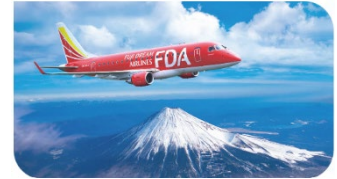
特別フライト遊覧