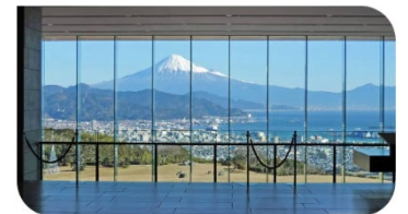
ホテルロビーから富士山を望む