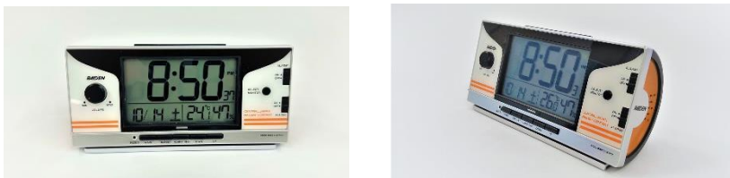
鉄道音ライデン 左：正面から撮影 右：斜めから撮影

ワイドビューチャイムやATS-ST音、車掌の声など鉄道に関する音を収録し、HC85系をモチーフとしたオリジナルデザインの大音量の目覚まし時計「ライデン」を製作するための資金を募集します。