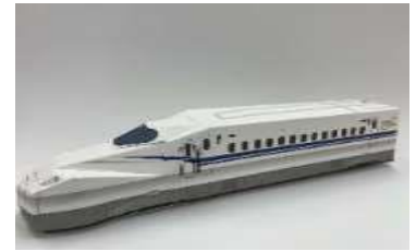
N700Sペーパークラフト （「動く！」タイプ）