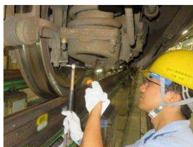
新幹線のメンテナンスの様子

新幹線車両を安全に走行させるためのメンテナンスについて勉強した後、社員と一緒に点検等を実際にご体験していただきます。