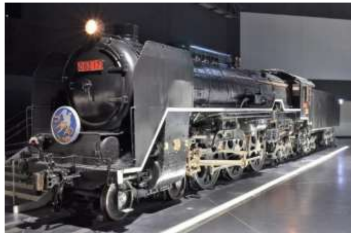
C62形式蒸気機関車17号機

「リニア・鉄道館」のホームページでもご案内しています。 (https://museum.jr-central.co.jp/)