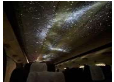
車内のイメージ ※状況により見え方が異なる場合がございます。