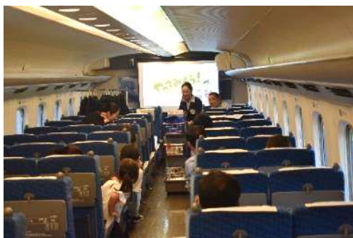
過去のお仕事紹介の様子