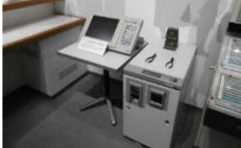
館内のマルス発券機

きっぷ販売の歴史等をご紹介した後、マルス発券機を用いたきっぷの発券、自動券売機や改札機等を使い、駅の営業業務をご体験いただけます。