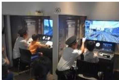
過去のお仕事紹介の様子