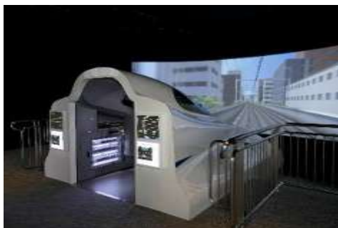
新幹線シミュレータ「N700」

新幹線シミュレータ「N700」を用いた運転体験教室です。社員による運転操作を見学した後、社員が先生となりながら、お子様にシミュレータを運転していただきます。