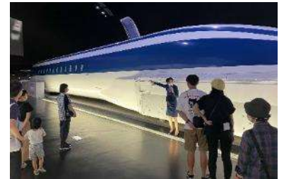
過去のツアーの様子