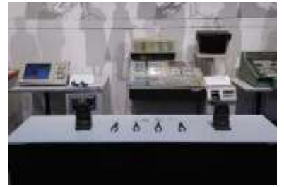
イベント開催場所の様子