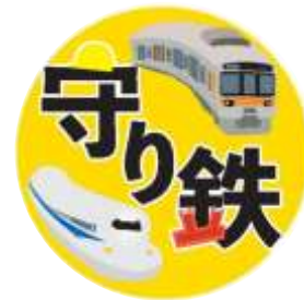
イベントロゴ (守り鉄)