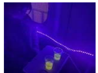
車内のイメージ ※状況により見え方が異なる場合がございます。