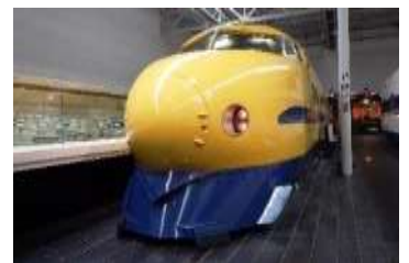
922形新幹線電気軌道総合試験車 (T3編成：ドクターイエロー)