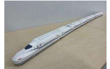
N700Sペーパークラフト （「伸びる！」タイプ）