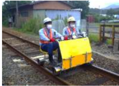
電動式のカート (他箇所での社員による操作の様子)