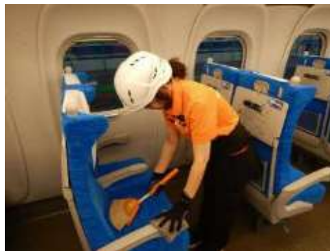
新幹線車内清掃の様子