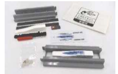
超電導リニアの模型 ※写真はキット2つ分です