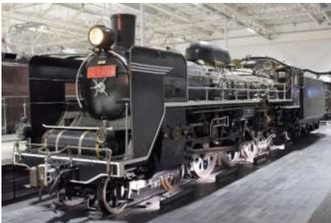
C57形式蒸気機関車139号機