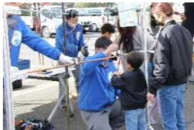
他箇所での類似イベントの様子

※メンテナンス体験の他に電気設備のお仕事で使用する道具等に触れるコーナーや軌陸車の運転席に乗れるコーナーを設置する予定です。当コーナーは各組の体験内容に関わらず皆様にご参加いただけるため、空き時間等にぜひお立ち寄りください。