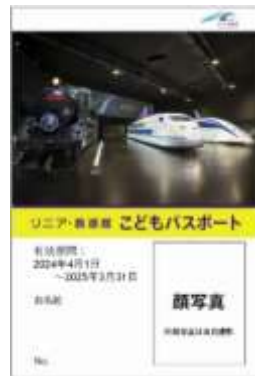
こどもパスポート（イメージ） ※サイズ：約5.4cm×約8.5cm