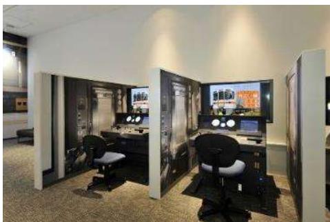
在来線シミュレータ「運転」

在来線シミュレータ「運転」を用いた運転体験教室です。社員による運転操作を見学した後、社員が先生となりながら、お子様にシミュレータを運転していただきます。