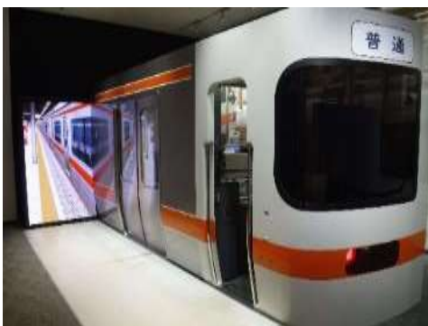
在来線シミュレータ「車掌」

在来線シミュレータ「車掌」を用いた車掌体験教室です。社員によるドア扱い、放送等の操作を見学した後、社員が先生となりながら、お子様にシミュレータを扱っていただきます。