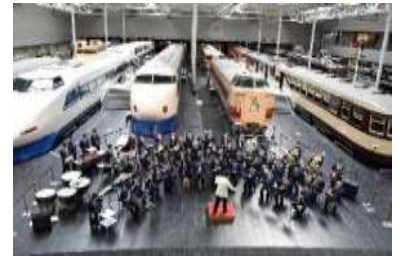
過去の同コンサートの様子