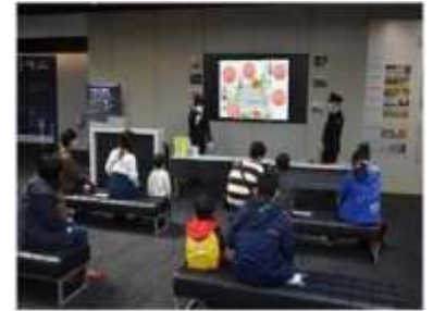
過去の類似イベントの様子

b) その他：押しボタン体験はi) 踏切安全教室の開催時間を除きご体験いただけます。また、ボタンを扱う際はスタッフまでお声掛けください。