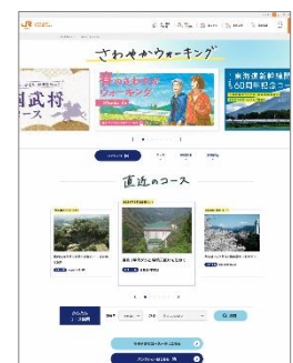
公式ホームページ