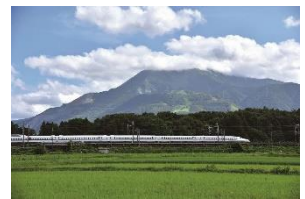
伊吹山と東海道新幹線