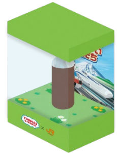
リニアの土(イメージ)