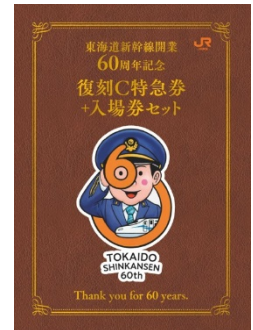
（復刻C特急券+入場券）