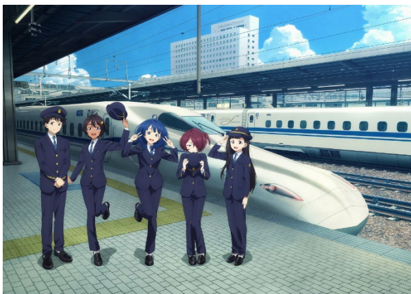
・描き下ろしキービジュアル