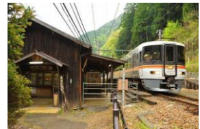
【小和田駅と飯田線秘境駅号】