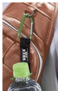
ペットボトルホルダー