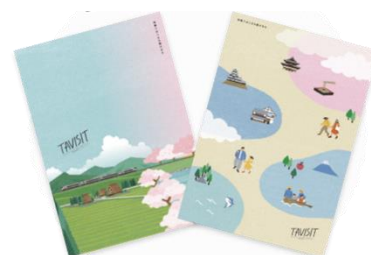
オリジナルノート

【URL】 https://market.jr-central.co.jp/tavisit/nanki-kumano20cp