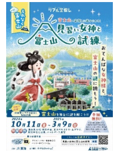
「見習い女神と富士山の試練」 チラシイメージ

【タイトル】「見習い女神と富士山の試練」 【期 間】2024年10月11日（金）～2025年3月9日（日）まで 【周遊箇所】清水魚市場 河岸の市、エスパルスドリームプラザ、 用宗みなと温泉、ハットパーク用宗