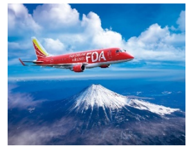
特別フライト遊覧