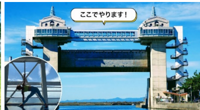
沼津港大型展望水門「びゅうお」