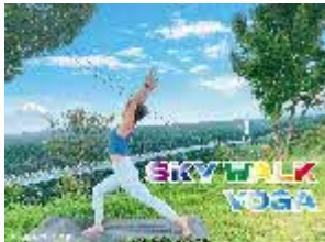
三島スカイウォーク