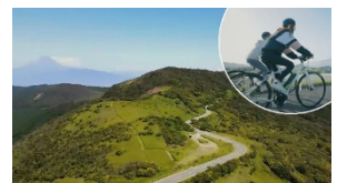
西伊豆スカイライン