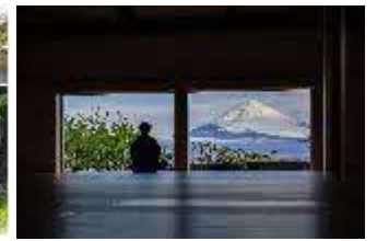
御殿場高原時之栖 禅堂