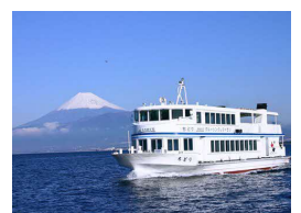
沼津港遊覧クルーズ