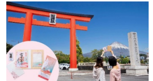
富士山本宮浅間大社と美咲良祈願

【設定日】2024年10月1日（火）～ ※12月29日（日）～1月3日（金）を除く