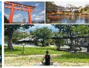
富士山本宮浅間大社神田川ふれあい広場