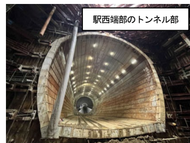
駅西端部のトンネル部

今回は、実際のシールドマシン発進部をスクリーンとして、シールドマシンによるトンネル掘削や、将来、リニアが走行する様子などをイメージした映像を、プロジェクションマッピングで投影します。