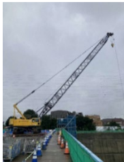
大型重機展示 （施工会社）