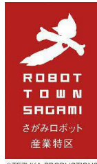
ロボット産業特区 （神奈川県）