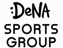
DeNAスポーツ グループ