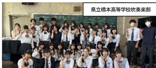
県立橋本高等学校吹奏楽部