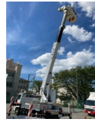
高所作業車 （東京電力PG）