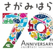
市制施行70周年 （相模原市）