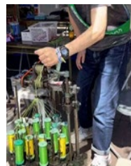
組紐体験 （相模原橋本RC）