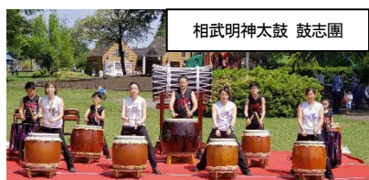
相武明神太鼓 鼓志団

駅地上部に設置したステージ、及びさがみはらリニアひろばにて、相模原市で活動されている団体の皆様によるパフォーマンスや、地元の小中高校生による演奏等を行うほか、JR東海音楽クラブ等によるコンサートも実施します。